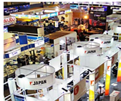
昨年のイベントの様子